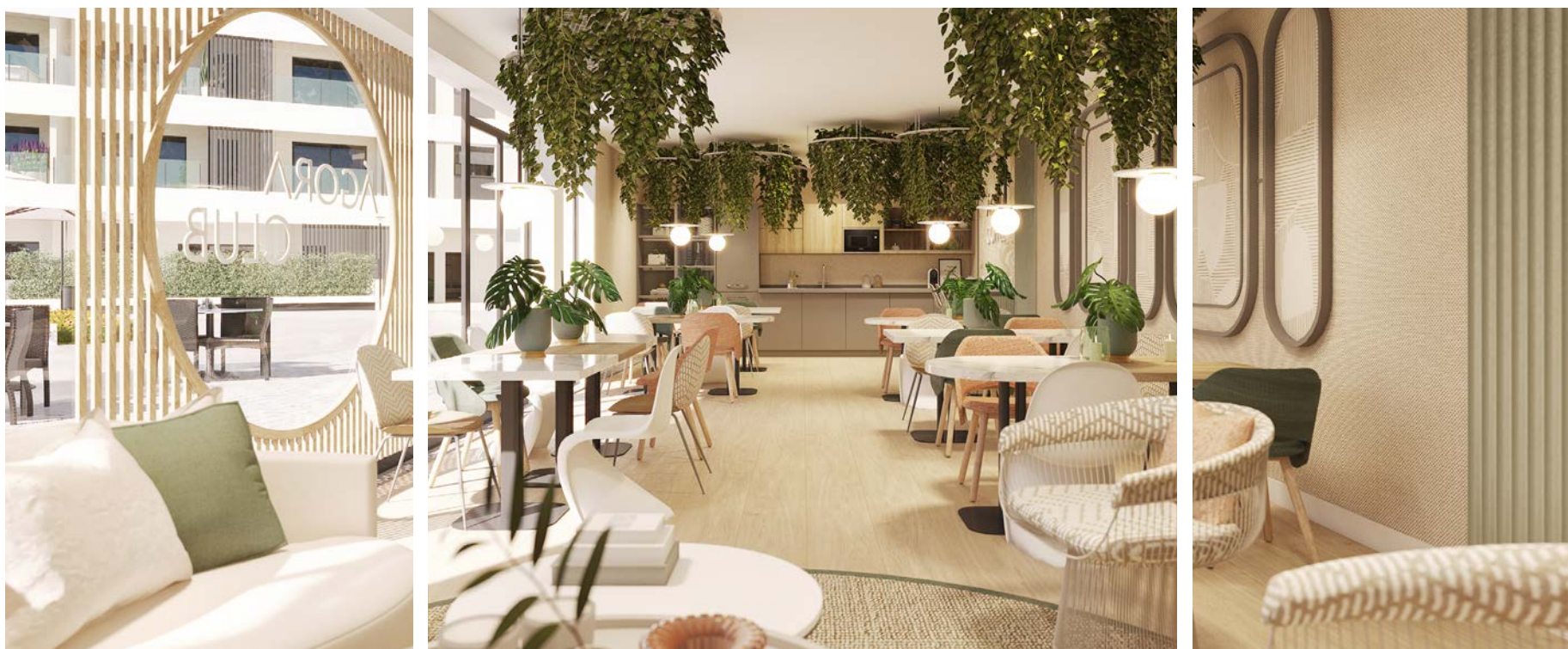
ÁGORA CLUB Modelo Salón Gourmet.